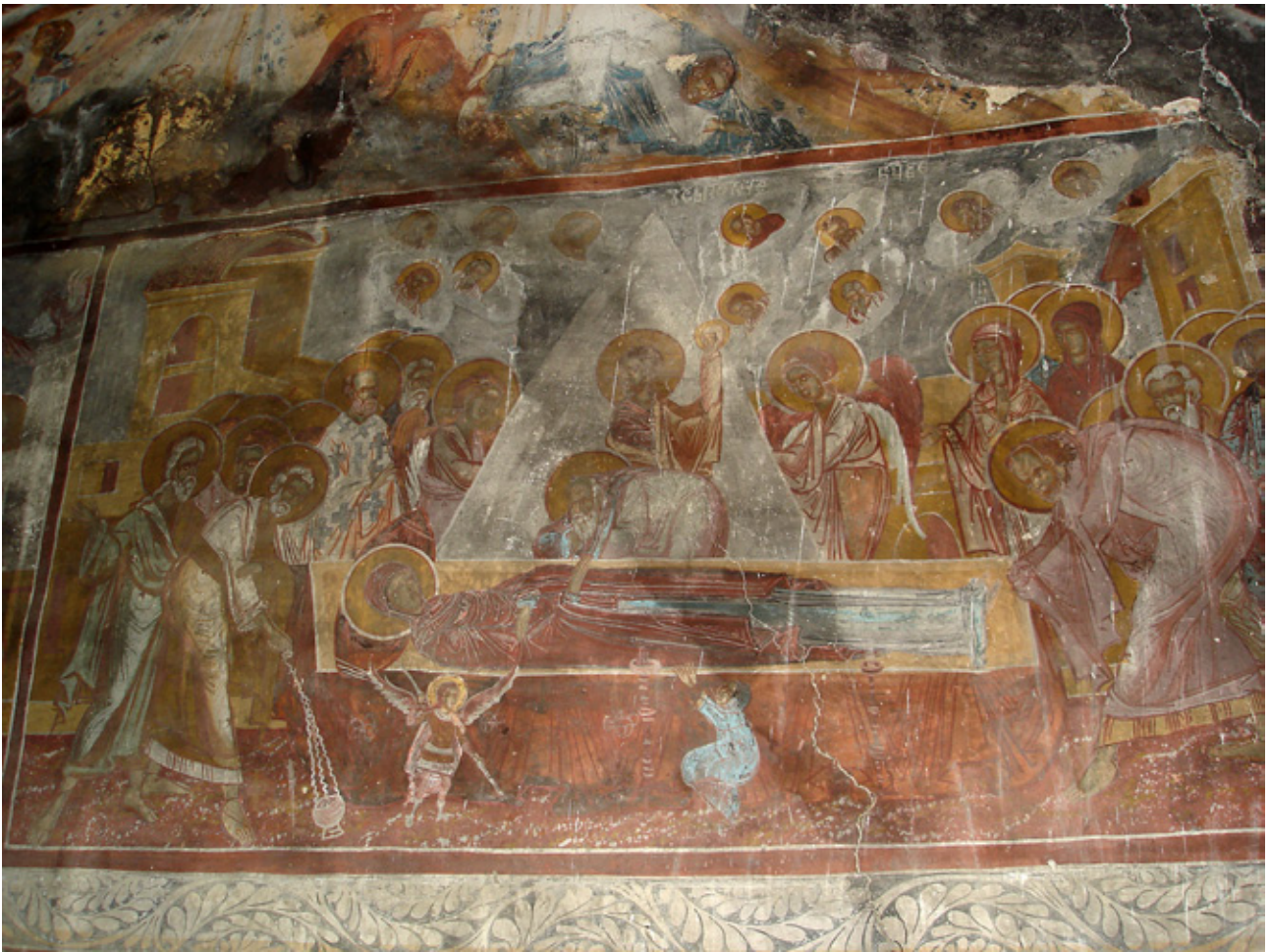
4. Успение на Богородица, црква Пресвета Богородица во Калуѓере

километри, и слетела на потег наречен Калуѓере, погоре од наведеное. Во ова предание има доста вистина, имено, станува збор за движењето на последните монаси кои го напуштиле манастирот Св. Архенгели и се упатиле најпрвин во тогаш најголемото село на жупа, Г. Љубиње, и тука престојувале извесно време, но по колективната исламизација на целото село биле принудени да најдат нова локација и тука да подигнат црква. 12