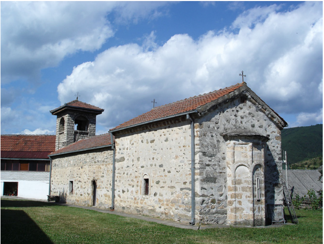
9. Црква Св. Никола во Штрпце

извршувале литии и молитви за успешна, мирна и родна година.