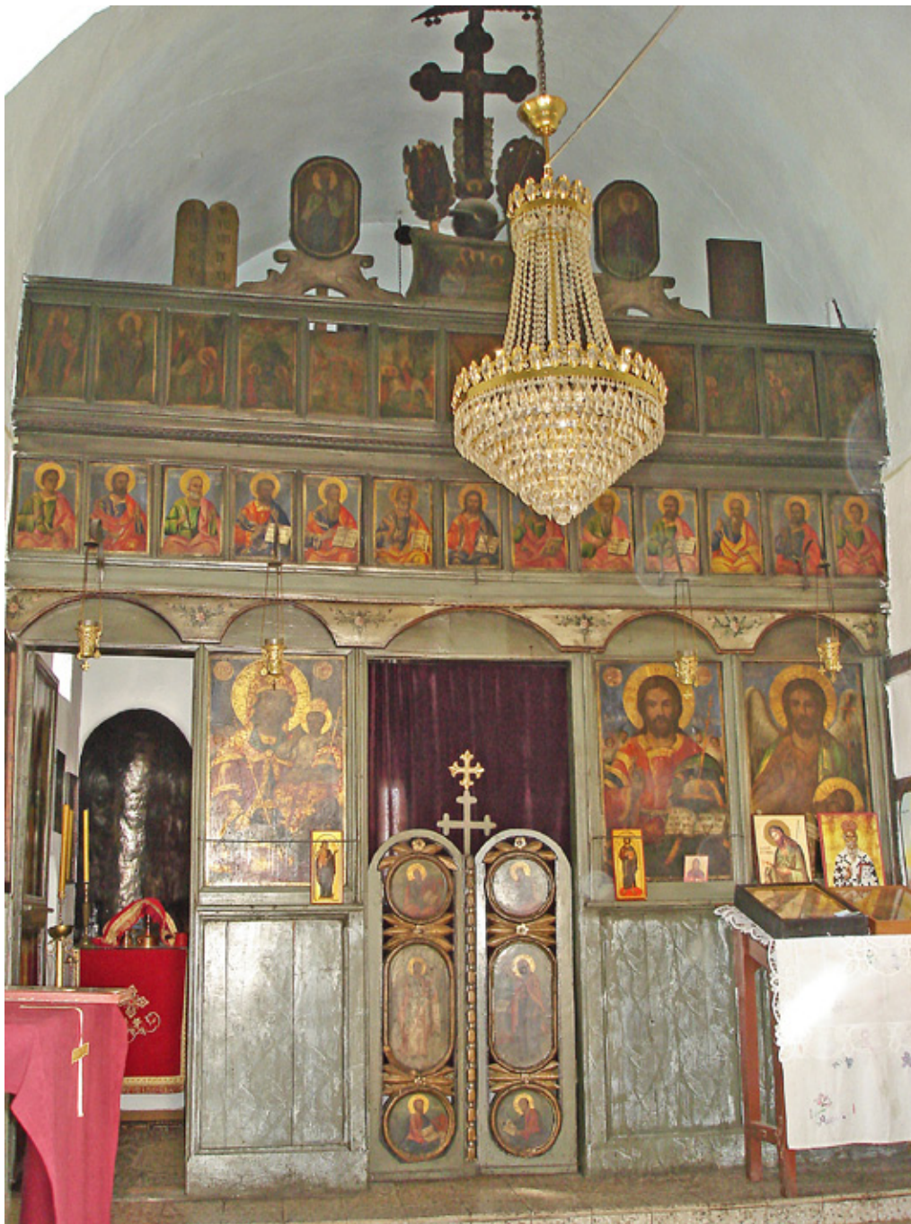
10. Црква Св. Никола во Штрпце