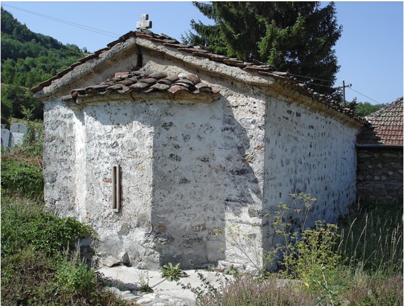
8. Црква Пресвета Богородица во Готовуша, Сириникска жупа