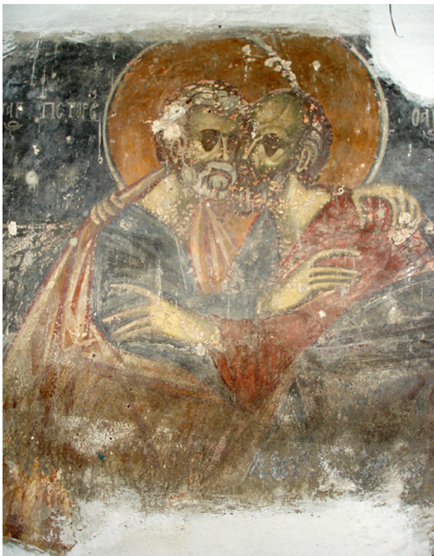
6. Св. Апостоли, црква Св. Апостоли Петар и Павле во Мушниково

Црквата Св. Никола се наоѓа во селцето Богошевац, во близина на селото Средска, на кое му припаѓа наведеното селце. Се претпоставува дека црквата е изградена во текот на првите децении на XVI век. Црквата Св. Никола е еднокорабна градба со правоаголна основа, засведена со полуобличест свод и со тристран завршок над апсидалниот дел, додека олтарскиот простор е одвоен со благо вовлечен дрвен иконостас. Прозорскиот отвор во олтарската апсида, влезот во средишниот дел од западниот ѕид и плитката ниша од северната страна се единствените отвори во ѕидовите на храмот. Добро зачуваниот живопис ја опфаќа до-