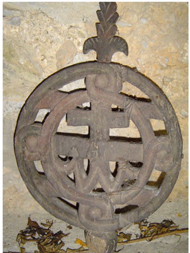
5. Литиски крст, црква Св. Никола во Богошевац

Црквата Св. Никола се наоѓа во населбата Драјчиќи, во близина на селото Средска. Нема податоци за времето на градењето на храмот. Ос-