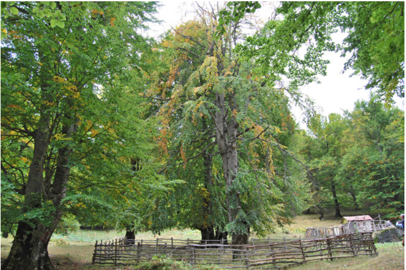
11. Шар планина, Г. Љубиње, локалитет Висните буке