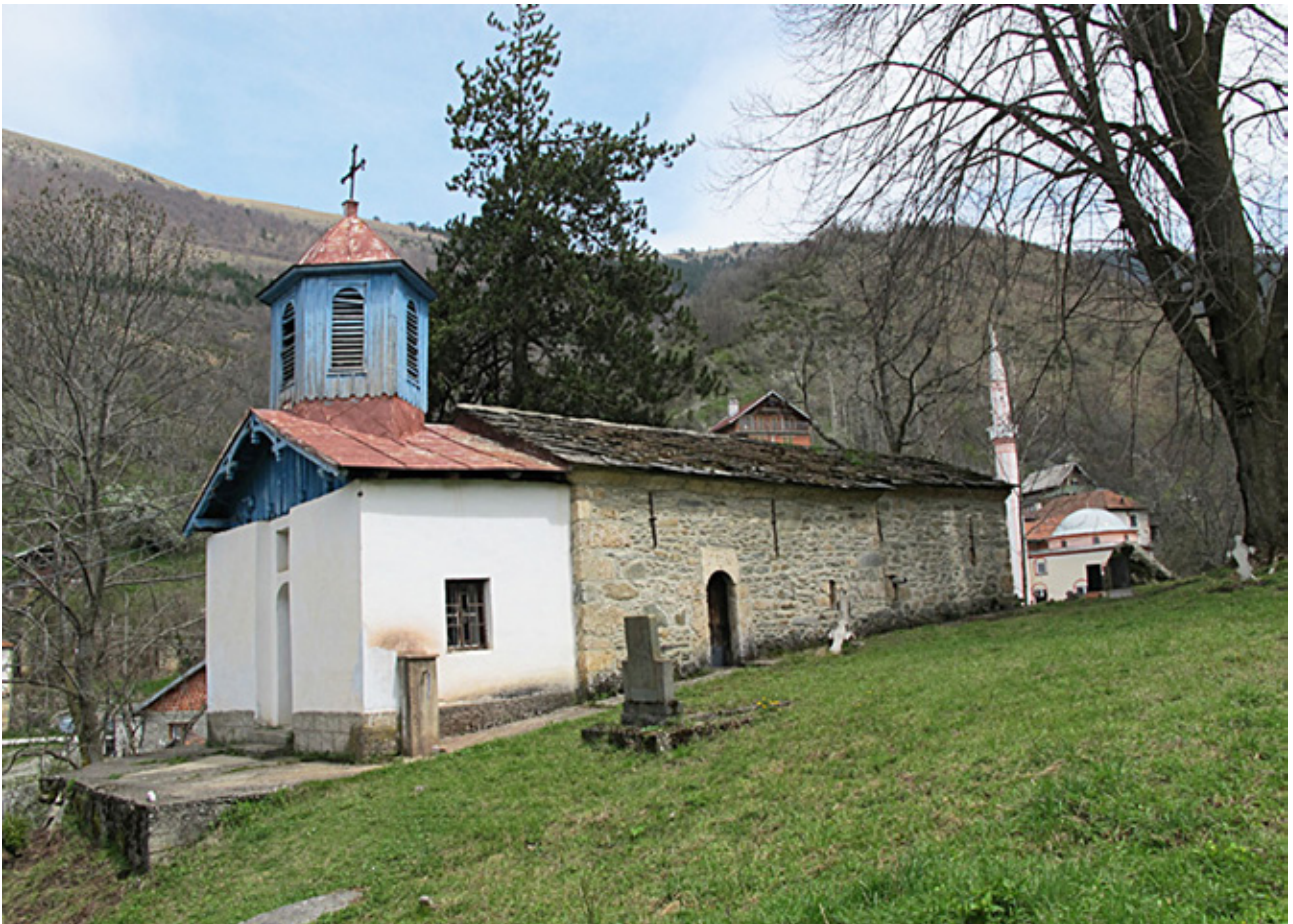
2. Црква Св. Ѓорѓи, Горњо Село, Средска

За жал, од наведените причини, а кои се резултат на повеќевековниот процес на исламизација на населението, Гора не зачувала ниту еден објект од сакралното градителство, останале само црквешта, гробишта, топоними, легенди и преда нија на некогашното христијанско минато на оваа наша древна средновековна шарпланинска жупа. Наведените показатели го докажуваат присуството на православниот елемент во селата на оваа жупа сè до 1856 година. 9