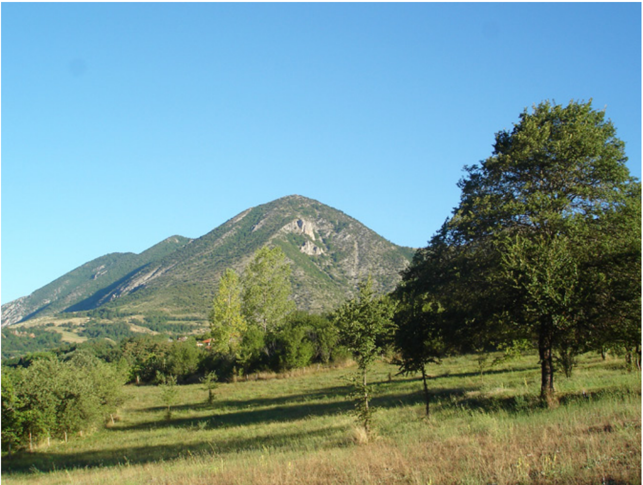
7. Испосница Мали Камењ и Голем Камењ

на. Бочните, полукружни ниши им припаѓаат на проскомидијата и на гакониконот. Мали, вообичаени прозорци, карактеристични за сите цркви со поскумни димензии се наоѓаат во средишниот дел од олтарот и на двете бочни страни. Влезот во црквата претставува едноставен правоаголен отвор, кој е нагласен со влезна рамка изработена од средачки камен, над кој е благо нагласена полукружна ниша за заштитникот на храмот. Црквата е ѕидана со делкан кршен камен, а сводовите и лаквите од делкан бигор. Фасадните челни места се рамни, без камен украс. Црквата е покриена со двоводен покрив, со благо исфрлен камен венец и покрив од камени плочи.