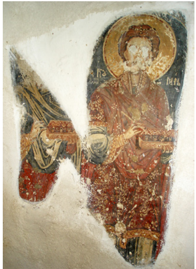
12. Црква Свети Ѓорѓи, селце Милачиќи, Средска