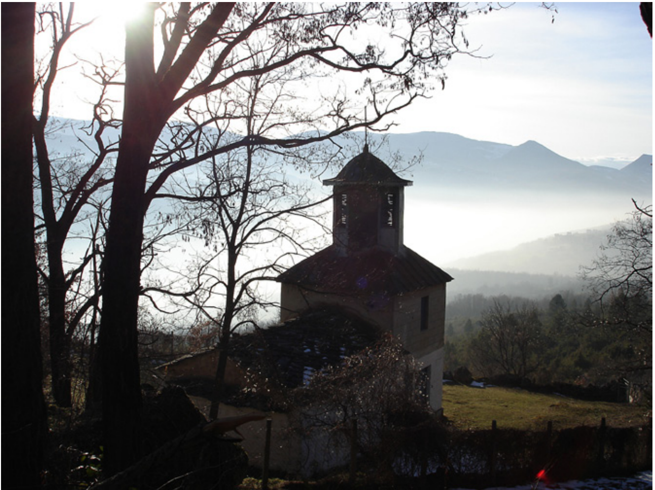
3. Црква Пресвета Богородица во Калуѓере

виќ) којашто ја подигнала по пребегнувањето од селото Свети Петар, денешен Кабаш, во близина на манастирот Св. Петар Коришки. Нема податоци за времето на градењето и живописувањето на фреските. Меѓутоа, постои претпоставка што се темели врз блискоста на сликарството на оваа црква и црквата Св. Петар и Павле во село Мушничово, дека и оваа црква е живописана во ист период, во XVI век.